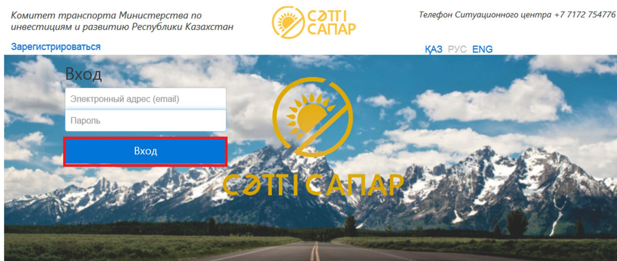
Рисунок 4. Главная страница

Для авторизации в «Сэтті сапар» на главной странице необходимо ввести электронный адрес, пароль и нажать на кнопку «Вход» (Рисунок 4).